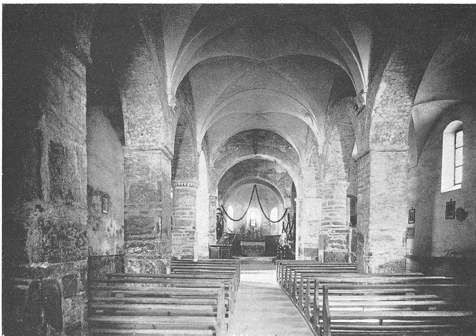
UNTEN: S. PIERRE DE CLAGES IM RHONETAL