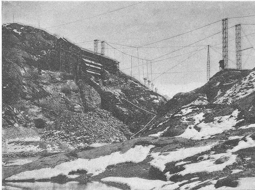
Abb. 18. Staumauer-Baustelle mit Beton-Zubereitungs- und Verteilungsanlage.

für die Zement-Transporte verwendet, so wäre er genötigt gewesen, den Zement zweimal umzuladen, das eine Mal vor der Anlage, die den Transport von Châtelard herauf besorgt (Standseilbahn oder auch Luftseilbahn), auf die Höhenbahn, und das andere Mal von der Höhenbahn auf die Anlage, die den Weitertransport von Emosson nach der Betonieranlage zu besorgen gehabt hätte. Bei der Luftseilbahn werden in wesentlich einfacher Weise die in Châtelard beladenen Wagen mit Intervallen von zwei Minuten auf das Vollseil aufgegeben und fahren bis zur Betonieranlage durch. Dort nimmt sie der Arbeiter in Empfang, schiebt sie über die Schienenschleife zur Entladestelle und von da zurück auf das Leerseil, auf welchem sie zur Ladestation Châtelard zurückkehren. Wir haben also nicht ein stossweises Ankommen grosser Mengen, sondern ein gleichmässiges Zufließen kleiner Ladungen. Dadurch wird der Betrieb wesentlich vereinfacht und lässt sich mit wenig Bedienungs-Personal bewältigen.