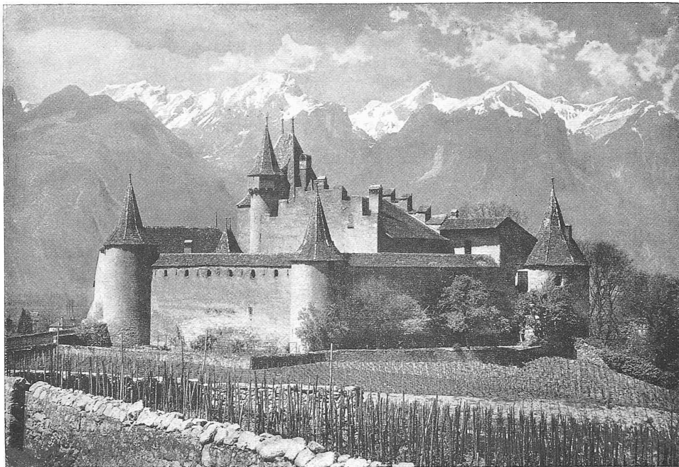
SCHLOSS AIGLE, WAADT- LÄNDISCHES RHONETAL