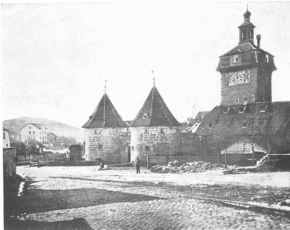
AUS: DIE ALTE SCHWEIZ — STADTBILDER, BAUKUNST UND HANDWERK HERAUSGEGEBEN VON E. MARIA BLASER — VERLAG EUGEN RENTSCH, ERLENBACH-ZÜRICH