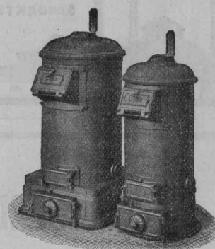
Kleinkessel, Modell I und II

Zu beziehen durch die Installationsfirmen.