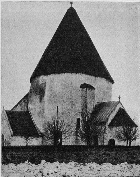
Abb. 1. St. Olaf-Kirche auf Bornholm. Um 1200.