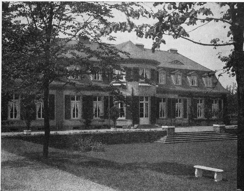
Abb. 1. Landhaus B. bei Hackhausen. Architekt Prof. Paul Schulze-Naumburg. Aus „Deutsche Kunst und Dekoration“. Verlag von Alexander Koch, Darmstadt (siehe unter Literatur).