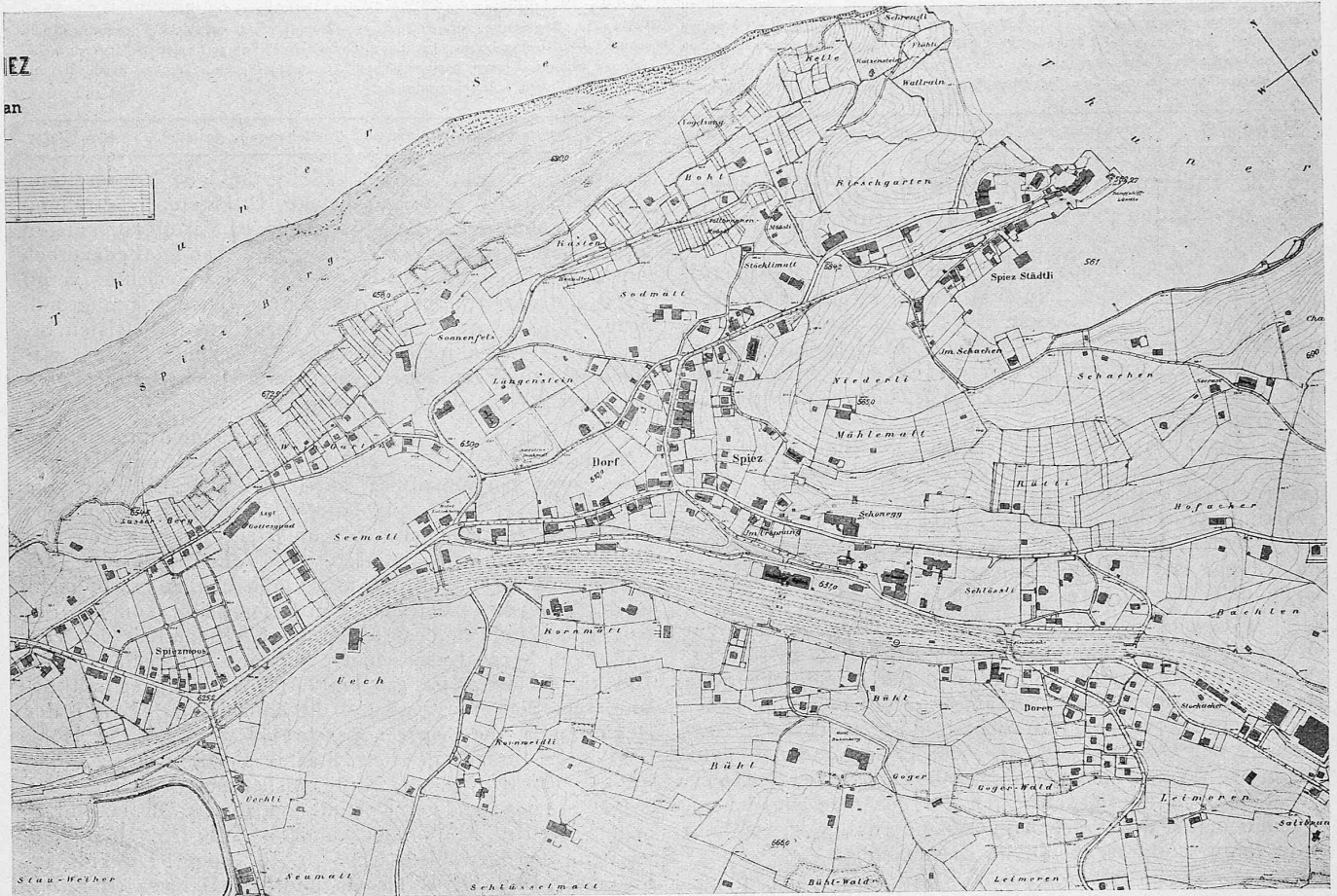
Ausschnitt aus dem Uebersichtsplan mit 2 m-Kurven zum Bebauungsplan-Wettbewerb für Spiez. — Cliché-Masstab 1:10000.

Eisenbahntechnik an und für sich schon ein eindrucksvolles Ereignis, so wurde der Kongress durch die zwei Jahrtausende Geschichte und Kunst, die die „Ewige Stadt“ umweben, durch die landschaftlichen Schönheiten Italiens und die opfervollen und gastfreundlichen Bemühungen der Behörden, denen Dank gebührt, zum Erlebnis. Mögen bis zum nächsten Kongress (1927 in Madrid) die Wunden des Krieges soweit geheilt sein, dass er wirklich international werden könne, d. h. dass keine Nation mehr ausgeschlossen sei, die in der Lage ist, Bedeutendes und Wertvolles zur Erkenntnis in Eisenbahnfragen im Interesse der Allgemeinheit beizutragen!