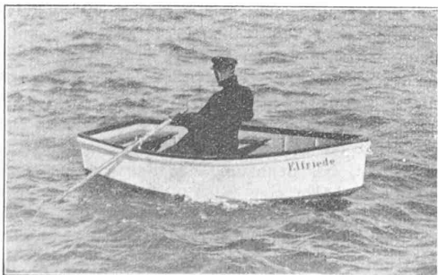
Abb. 1. Kleines Ruder- und Beiboot aus Duralumin.

Seit Bestehen der Eisenbahnen gewann der Gedanke der Alpen-Ueberschneidung immer mehr Gestalt. Vor den unwirtlichen Höhen machte jedoch die Phantasie des Ingenieurs halt. Eine Durchtunnelung der gewaltigen Kette in Höhen, die das ganze Jahr mit der Bahn erreichbar, erschien zunächst noch ausgeschlossen. Sommeiller brach den Bann. Gemeinsam mit den Ingenieuren Grattoni und Grandis aus Turin legte er Cavour ein Projekt für die Unterfahrung des Col du Fréjus durch einen 12820 m langen, zweispurigen Tunnel vor, zu dessen Erstellung zum ersten Mal die Bohrmaschine verwendet werden sollte. 1857 nahm das piemontesische Parlament ein von Cavour eingereichtes Gesetz an, wonach ein Kredit für Versuche im Grossen mit der Bohrmaschine bei Genua bewilligt wurde — in jener hochpolitischen Zeit eine bemerkenswerte Tat eines Parlamentes. Die Versuche fielen günstig