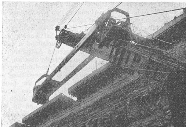
Abb. 25. Bagger-Typ 225 B beim Entladen auf die Bahnwagen.

Die grössten Bagger laden Erd- und Felsmaterial direkt in die eisernen Transportwagen, deren Geleise 20 bis 25 m über dem Geleise des Baggers liegt (Abbildungen