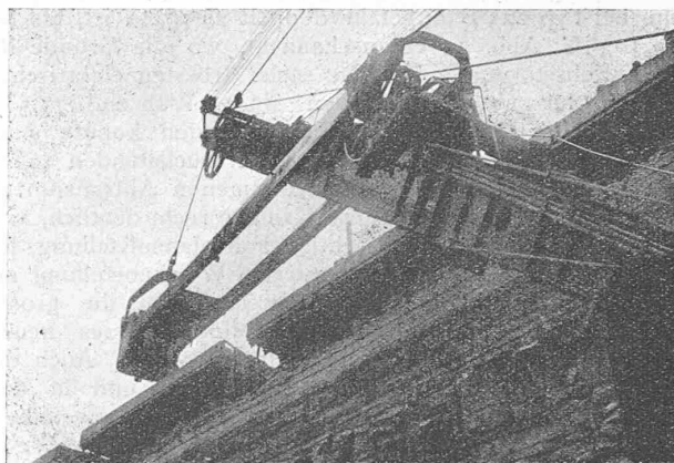
Abb. 25. Bagger-Typ 225 B beim Entladen auf die Bahnwagen.

Die grössten Bagger laden Erd- und Felsmaterial direkt in die eisernen Transportwagen, deren Geleise 20 bis 25 m über dem Geleise des Baggers liegt (Abbildungen