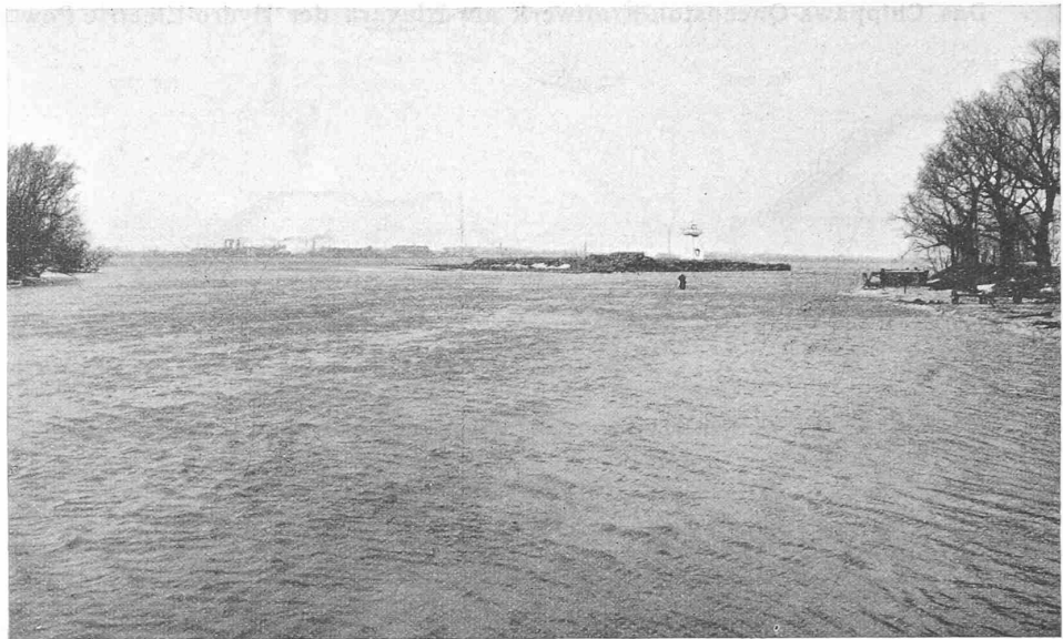
Abb. 7. Mündung des Welland River in den Niagara, jetzt Kanal-Einlauf, bei Chippawa.

Die Berechnung der Wassermenge mit Hilfe dieser Formel ist, wie man sieht, eine sehr komplizierte, und wenn man noch berücksichtigt, dass die einzelnen Grössen in der Formel nicht immer mit der wünschenswerten Genauigkeit ermittelt werden können, so darf man wohl sagen, dass die von Gibson vorgeschlagene Methode keinen Fortschritt in der Ausführung von Wassermessungen bedeutet.