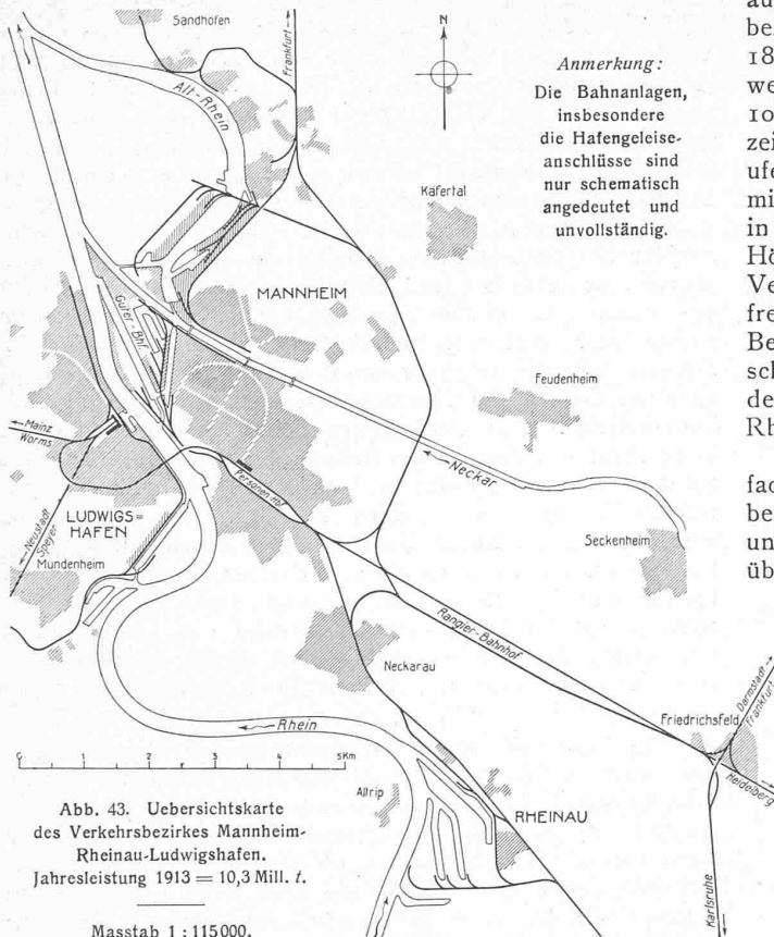
Abb. 43. Uebersichtskarte des Verkehrsbezirkes Mannheim-Rheinau-Ludwigshafen. Jahresleistung 1913 = 10,3 Mill. t.