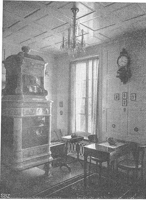
Abb. 7. Blick ins Stübli („Zimmer 1“ im Grundriss).

Unsere Bilder vermögen mangels der Farbigkeit natürlich nur einen unvollständigen Eindruck dieses eigenartigen Landsitzes zu bieten. Sie lassen aber doch ahnen, mit welcher Liebe sich die Architekten in die Aufgabe vertieft und welche Sorgfalt sie auf die Ausarbeitung aller Einzelheiten — es sei nur verwiesen auf die Decke, die geschnitzten Möbel und den traulicher Erker des Wohnzimmers — verwendeten. Sie lassen auch erkennen, in wie hohem Mass es ihnen gelungen ist, die aussergewöhnlichen Wünsche des Bauherrn in Uebereinstimmung