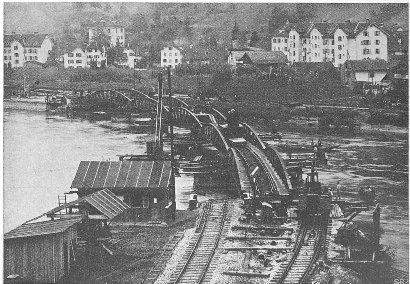
Abb. 7. Die Brücke während der Verschiebung flussabwärts (von links nach rechts).

Lehm, der mit Kies und grossen Steinen durchsetzt ist. Pfeiler III ist auf einer dünnen Nagelfluh abgesetzt, Widerlager Seite Zürich auf feinem scharfen Sand und Widerlager Seite Luzern auf festgelagertem, grobem Geschiebe, Für den Aufbau der Pfeiler und Widerlager waren 60 bis 70 cm hohe Quader aus Solothurner Kalkstein verwendet worden, die sich als wetterbeständig erwiesen haben. Beim Bau der ersten Brücke wurde der rechtsseitige Fluss-