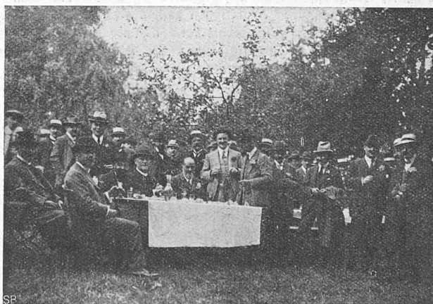
Abb. 2. (Erster) Frühschoppen an der Aare bei der Neubrücke.