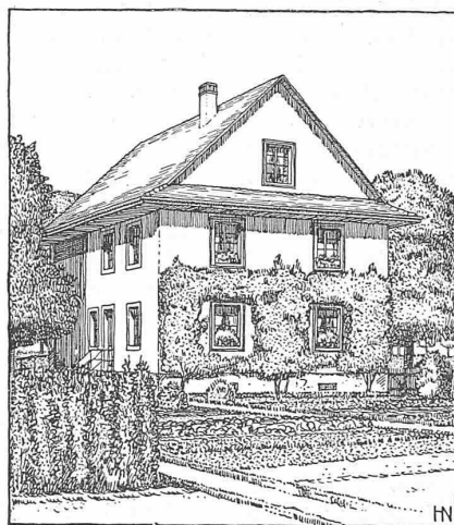
Abb. 2. Ansicht.

Lehmhäuser in Fislisbach bei Baden (Aargau), erbaut 1849.