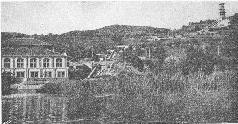
Abb. 1. Blick auf Maschinenhaus, Druckleitung und Wasserschloss.

Auf keinem technischen Gebiete ist heute das Interesse des Technikers wohl derart rege, wie in Fragen wasserwirtschaftlicher Natur. Namentlich in unserm Lande, das in seinen Wasserkraften einen grossen Reichtum birgt, werden seit Jahren bedeutende Anstrengungen gemacht, um unter dem Schutz und mit der Mithilfe der Bundesregierung die Wasserkräfte so rationell wie möglich auszunützen, zu Gunsten der Allgemeinheit; ein grosser Schritt wird damit vorwärts getan, um das Land mehr und mehr von der Kohlenversorgung durch das Ausland unabhängig zu machen.