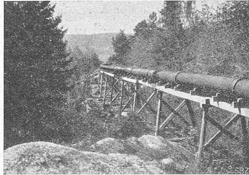
Abb. 2. Pumpwasserleitung der Zellulosefabrik Moelven. Spiralumschnürte hölzerne Muffenröhren, Durchmesser 480 mm.

Ganz wird man den Forderungen, die in dieser Erkenntnis liegen, wohl erst gerecht werden, wenn man eine Methode der künstlerischen Erziehung findet, in der die wirkliche praktische Architektenarbeit am werdenden Bau eine entscheidende Rolle spielt. Es liegt auf der Hand, dass der lehrende Meister den Schüler ganz anders in die Lebensfragen seines Berufes einführen könnte, wenn er ihn statt am Entstehen einer fingierten Bauaufgabe am Entstehen einer wirklichen Bauaufgabe teilnehmen lassen könnte. Hierfür hat Theodor Fischer in einer Studie „Von deutscher Baukunst“ einen Vorschlag aufgebaut, der ernstester Beachtung wert ist. Seine Durchführung setzt aber so weitgreifende Umgestaltungen unseres ganzen öffentlichen Bauwesens voraus, das es zu weit führen würde, den ganzen Gedankengang hier zu entwickeln. Er kommt zu einem Ergebnis, das die Erziehung des Architekten in drei Abschnitte zerlegt: eine Vorstufe, die nach ähnlichen Gesichtspunkten, wie sie im Vorstehenden erörtert sind, die Grund-