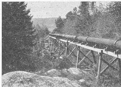
Abb. 2. Pumpwasserleitung der Zellulosefabrik Moelven. Spiralumschnürte hölzerne Muffenröhren, Durchmesser 480 mm.

Ganz wird man den Forderungen, die in dieser Erkenntnis liegen, wohl erst gerecht werden, wenn man eine Methode der künstlerischen Erziehung findet, in der die wirkliche praktische Architektenarbeit am werdenden Bau eine entscheidende Rolle spielt. Es liegt auf der Hand, dass der lehrende Meister den Schüler ganz anders in die Lebensfragen seines Berufes einführen könnte, wenn er ihn statt am Entstehen einer fingierten Bauaufgabe am Entstehen einer wirklichen Bauaufgabe teilnehmen lassen könnte. Hierfür hat Theodor Fischer in einer Studie „Von deutscher Baukunst“ einen Vorschlag aufgebaut, der ernstester Beachtung wert ist. Seine Durchführung setzt aber so weitgreifende Umgestaltungen unseres ganzen öffentlichen Bauwesens voraus, das es zu weit führen würde, den ganzen Gedankengang hier zu entwickeln. Er kommt zu einem Ergebnis, das die Erziehung des Architekten in drei Abschnitte zerlegt: eine Vorstufe, die nach ähnlichen Gesichtspunkten, wie sie im Vorstehenden erörtert sind, die Grund-