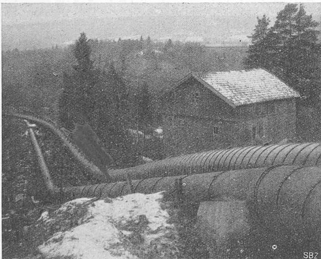
Abb. 6. Hölzerne Druckleitung (rechts) des Kraftwerkes Eidsvold, Durchmesser 1000 mm, Drukhöhe 48 m; zum Ersatz der links davon liegenden ältern Eisenrohrleitung.

In einer Plauderei über alte und neue Brücken bei Eglisau machte „Der alte Steinhauer“, ein in Zürich wohlbekannter Baumeister, in der „N. Z. Z.“ vom 12. ds. M. (Nr. 1232) u. a. von der Eisenbahnbrücke über den Rhein unterhalb Eglisau die etwas alarmierende Mitteilung, dass deren Flusspfeiler sich infolge der Tem-