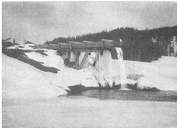
Abb. 2. Mündung des Todtalp-Baches in den gesenkten Davosersee während der Schneeschmelze (die Holzrinne verhindert die Schluchtbildung).

politischen Gemeinde Davos betr. die Konzessionserteilung für die Seesenkung, andererseits ein Vertrag betr. Verwertung dieser Konzession zwischen den Elektrizitätswerken Davos und Zürich zustande. Der Vertrag gestattet die Absenkung des Sees vermittels einer schwimmenden Pumpanlage um je 7 bis 10 m in drei, und wenn Davos an der Senkung ein besonderes Interesse haben sollte, in sechs Winterperioden.