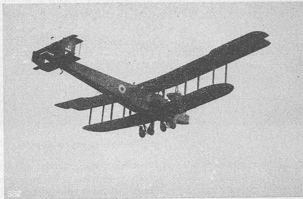
Abb. 21. Englisch „Handley-Page“-Bombardierungs-Gross-Flugzeug.

Die zweite Art: der Fournier-Rumpf , der sich besonders während des Krieges Eingang verschafft hat, unterscheidet sich in der Hauptsache vom Gitterträger nur durch seine Fournier-Bekleidung. Formgebend sind wieder die Holmen. Statt der Streben sind Bogen eingebaut mit den notwendigsten Verspannungen. Diese Konstruktion ergibt ein viel einfacheres und leichteres Skelett als der Gitterträger (Abb. 16, S. 157). Zur Verkleidung wird kreuzweise geschichtetes Fichten- oder Erlen-Fournier von insgesamt 3 bis 5 mm Dicke verwendet (Abb. 17, S. 157). Es lassen sich mit dieser Bauart sehr zweckmässige und viel elegantere Formen erreichen, die auch den Vorteil grösserer Festigkeit und Leichtigkeit besitzen. Wenn ich von „elegant“ spreche, denke ich dabei besonders an die schönen Kabinen der Luft-Limousinen für Passagier-Flüge. Ein empfindlicher Nachteil ist nur dann zu vermerken, wenn das Holz allfällig zu arbeiten beginnt und sich der ganze Rumpf verzieht. Eine Korrektur ist dann nicht so einfach vorzu-