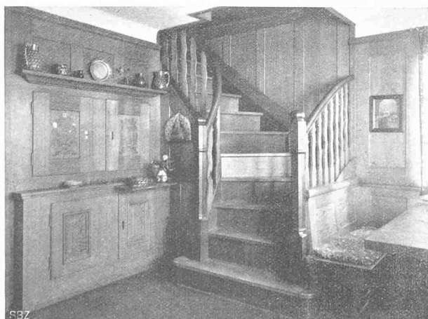
Abb. 14. Diele mit Treppen-Aufgang im Hause Arch. F. Ulrich.

Die Wichtigkeit des möglichst raschen Ausbaues dieser Werke ergibt sich, wenn berücksichtigt wird, dass im Jahre 1917/18 die sämtlichen staatlichen und kommunalen Dampfkraftwerke Gross-Britanniens bei einem Kohlenverbrauch von 7,16 Mill. t 4628 Mill. kWh erzeugten, sodass bei Annahme gleicher, durchschnittlicher Betriebsverhältnisse durch den Ausbau der neun schottischen