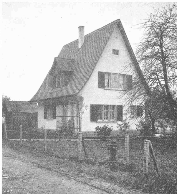
Abb. 11. Haus Arch. F. Ulrich, von Nord-Ost.

grösseren Wasserkraftanlagen in Schottland allein nicht nur für eine Reihe von Jahren für eine grössere Anzahl Arbeiter willkommene Arbeitsgelegenheit beschafft werden könnte, sondern dass dadurch auch eine konstante Abgabe von 183500 kW oder von jährlich rund 1200 Millionen kWh gesichert würde. Die nachstehende Tabelle gibt Auskunft über Lage, Leistung, geschätzte Anlagekosten und Arbeiterzahl der einzelnen Werke.