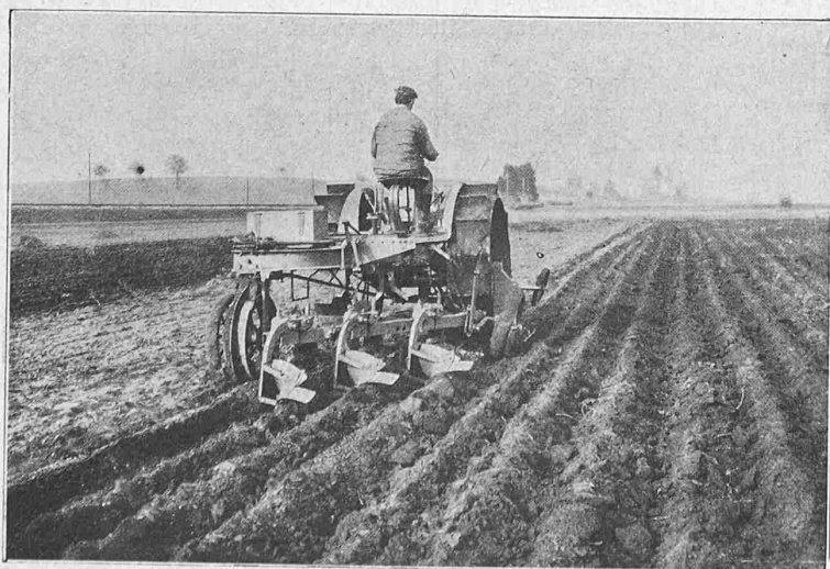
Abb. 2. Der Motorpflug „Winterthur“ in Hinteransicht.

Bei allen diesen Raffinationsverfahren, die der Hauptsache nach in der Durchführung eines Oxydations- (Frisch-) Prozesses mit nachfolgender Desoxydation bestehen, werden die, das Eisen