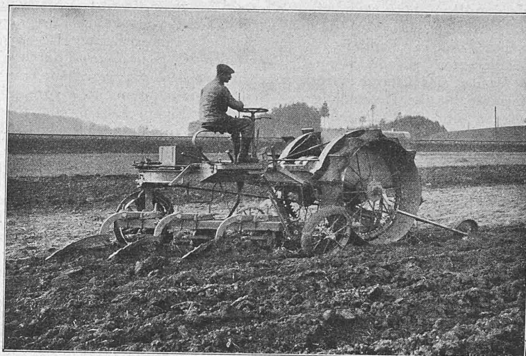
Abb. 1. Der Motorpflug „Winterthur“ in Seitenansicht.

Bis in die neuere Zeit wurde aller Stahl, der zur Erzeugung von Stahlformguss diente, hauptsächlich nach drei Verfahren hergestellt, die ihrem Wesen, sowie ihrer technischen und metallurgischen Durchführung nach, von einander durchaus verschieden sind. Es sind dies, wie bekannt, das Tiegelschmelzverfahren, der Martinprozess und das Kleinbessemerv Verfahren.