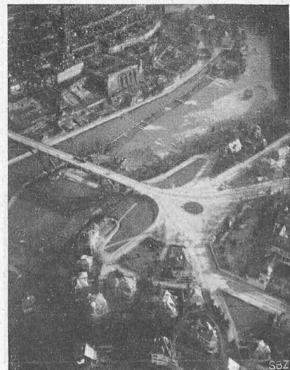
Abb. 4. Kirchenfeldbrücke, Helvetia-Platz und Historisches Museum (am Bildrand rechts).