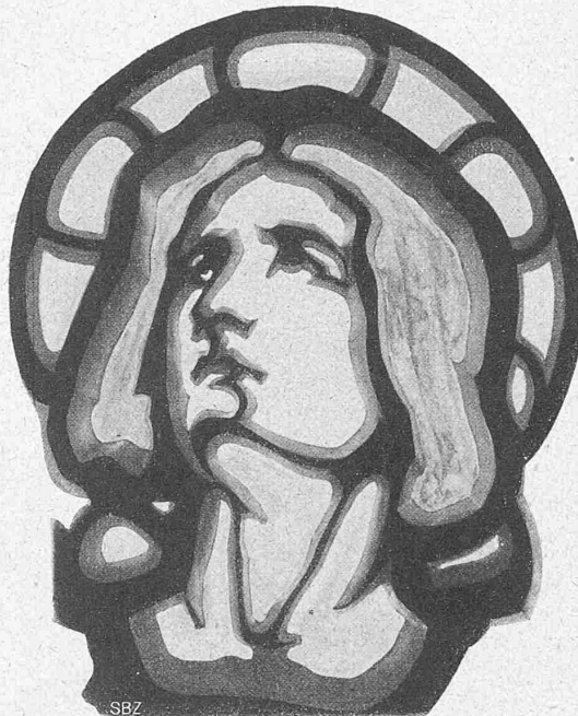
Abb. 6. Gerippe zum Kopf des Apostels Johannes aus einem Kunststein-Fenster von Richard A. Nüscheler.