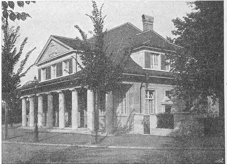
Abb. 2. Polizeiposten am Wielandplatz in Basel.

Das Wachtlokal als Hauptraum wird in der Mitte direkt von der Vorhalle aus betreten und hat, mit Ausnahme einer Kastenwand und Sitznische, keinen weiteren Ausbau erhalten (Abb. 3 bis 6). Rechts davon liegt sich das Bureau des Postenchefs, daneben die Treppe zum ersten Stock, mit besonderem seitlichem Hauseingang. Im Kasten-