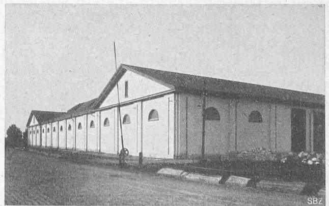
Abb. 2. Längsfront an der Münchensteinerstrasse und Rückfront.

La perfection et la beauté de toutes ces choses sont d'une parenté si frappante et si nettement caractérisée, qu'il n'importe, pour créer un hôtel, un café, un cinéma, un bureau ou des intérieurs de maison parfaits et beaux, que des renseignements suffisants et un goût éclairé et sûr.