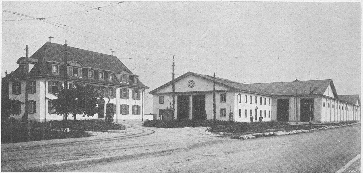
Abb. 1. Gesamtbild des Strassenbahndepot auf dem „Dreispitz“ in Basel. — Architektonische Durchbildung von Arch. H. Bernoulli, Basel.

Le principe de la construction rationnelle et conséquente n'a pas pénétré depuis la construction en ciment armé. Je pose en fait que nous pourrions compléter dès à présent jusque dans ses moindres détails l'installation d'un édifice, dont l'aspect et la forme répondraient strictement à la conception de ce qu'il doit être , d'objets et d'ustensiles dont l'aspect et la forme répondraient à la même condition.