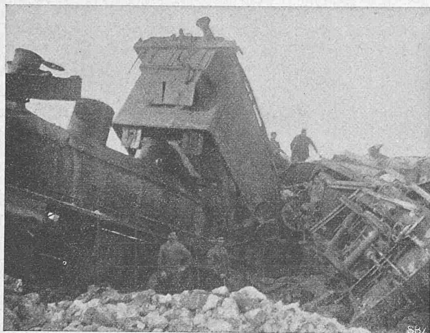
Abb. 6. Brücken-Einsturz auf der Strecke Gafsa-Metlaoui der Gafsaabahn.