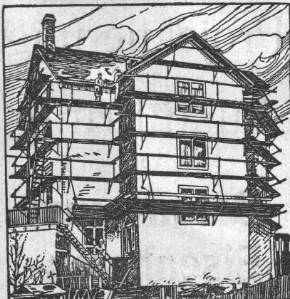
Schweizerische Landesausstellung 1914: 1 goldene und 2 silberne Medaillen.