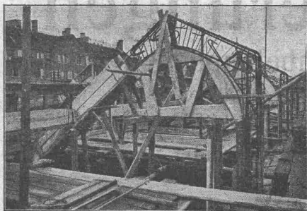
Shedbau in arm. Beton der Seidenfärberei J. Meyer, an der Limmatstrasse in Zürich 5.

Foundationen Brückenbau Wasserbauten Reservoirs, Silos Massivdecken nach eigenen bewährten Systemen. Hoch- u. Industriebauten