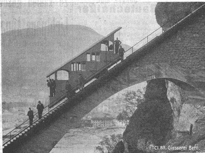
Cl. 83. Giesserei Bern.