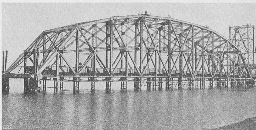
Einzuhängender Mittelträger der Quebec-Brücke, auf dem Montagegerüst (Nach „Eng. News“ v. 24. Aug. 1916).