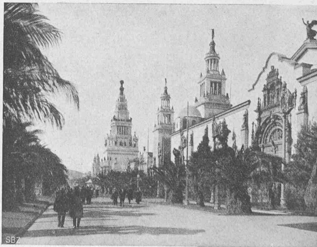
Abb. 45. Die Palmenallee in der Ausstellung.

Die Panama-Pacific-Weltausstellung überraschte in doppelter Hinsicht: erstens, bezüglich der äusseren Erscheinung, der sehr grosse Mittel geopfert worden sind; das Ausstellungsbild war ein sehr prächtiges, überreich mit gut durchgearbeiteten Einzelheiten übersät, wenn auch die Architektur, wie in Californien nicht anders zu erwarten, keinen reinen Styl bot (Abbildungen 44 bis 50). Auch hier zeigte sich die Vorliebe der Amerikaner für den „klassischen Styl“, stark beeinflusst durch den sogenannten „Missionsstyl“, der von den Spaniern und Mexikanern, die bis 1846 Herren des Landes waren, eingeführt worden war, und der eine Mischung französischer und italienischer Renaissance mit den maurischen Formen darstellt. Die Gartenanlagen zwischen den einzelnen Hauptgebäuden waren recht geschickt angelegt, wobei zu beachten ist, dass der grösste Teil der Ausstellungsanlagen Sandboden war. Die unregelmässig in gelblich-grauem Ton verputzten Wandflächen der Gebäude wirkten recht günstig auf das Auge.