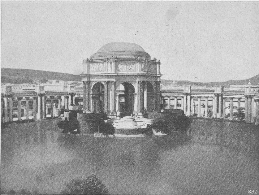
Abb. 47. Die Kunsthalle (gegen Westen gesehen).

Anmerkung der Redaktion. Der Herr Berichtstatter, sowie die geehrten Leser wollen auch uns ein paar Bemerkungen zu den Bildern dieser, teilweise sehr geschmackvollen, amerikanischen Ausstellungs-Architektur erlauben.