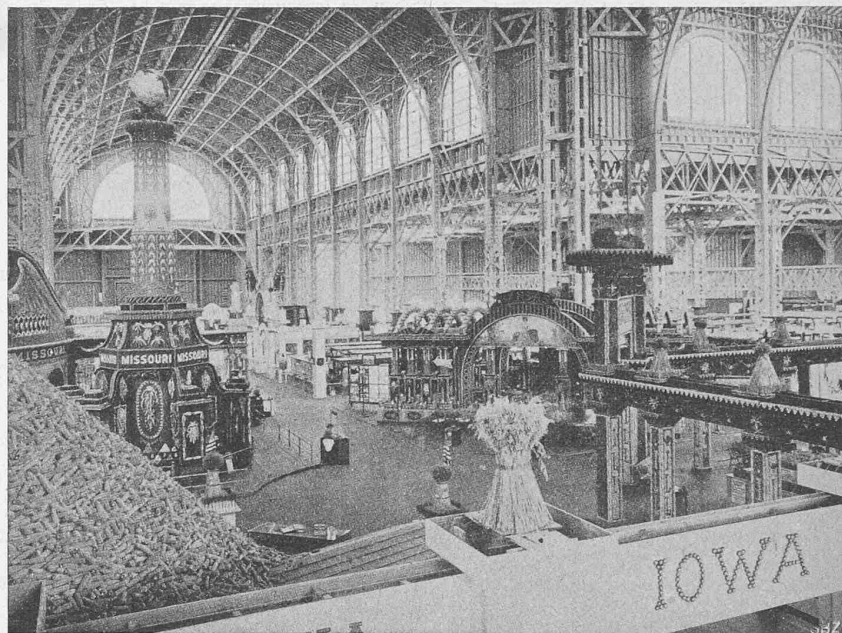
Abb. 51. Inneres einer Halle für landwirtschaftliche Produkte. — Weltausstellung San Francisco 1915.