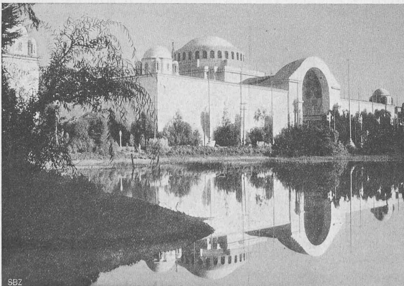
Abb. 48. Erziehungs-Palast (gegenüber dem Kunstpalast Abb. 47).

Enttäuscht hat mich dagegen das Innere der Hallen, die Art der Ausstellungsgegenstände. Es handelte