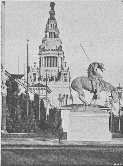
Abb. 50. „End of the trail“ (Am Ende der Indianerspur). Im Hintergrund der „Tower of Jewels“.

Hervorzuheben sind: die acht Hauptgebäude für Gewerbe und Industrie, Nahrungsmittel, Bildungsmittel, Transportmittel, Bergbau usw., die zusammengruppiert waren, und an die sich am einen Ende die Maschinenhalle, am andern Ende die Kunsthalle anschlossen. Diese Halle, die bestehen bleiben soll, ist 290 m lang und 41 m breit. Das Tragwerk besteht aus eisernen Dreigelenkbogen im Gesamtgewicht von 1300 t.