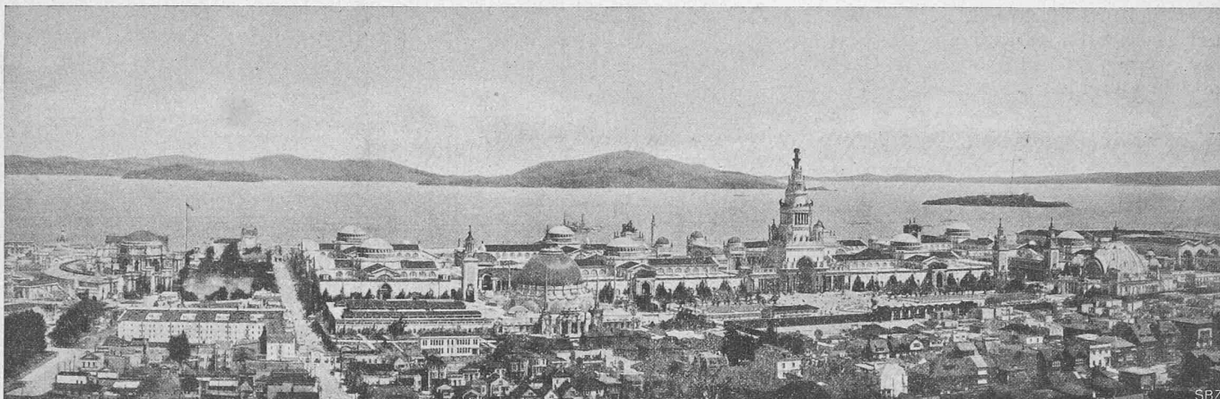
Abb. 44. Gesamtbild der Weltausstellung 1915 und der Bay von San Francisco, gegen Norden gesehen (rechts das Festland).