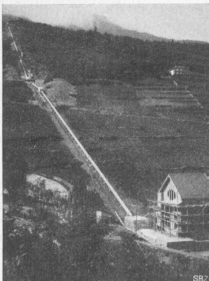
Abb. 17. Druckleitung und Maschinenhaus.

Nach eingehenden Versuchen, die über den tatsächlichen Druckverlust der Leitung gemacht wurden, kann dieser für die vorliegenden Verhältnisse ( d = 1000 mm, l = 860 m) nach der Formel berechnet werden: h_v = 2,25 Q^2 . Hiernach