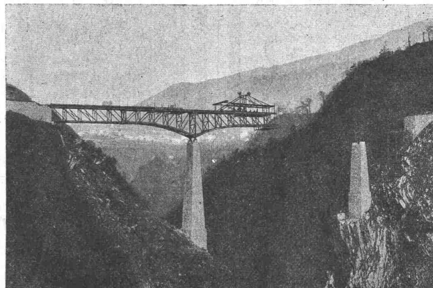
Pont-route sur la Breggia, entre Castello et Morbio-Superiore (Tessin), construit en 1912. Longueur 110 m.