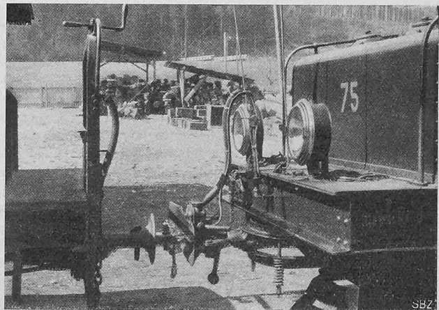
Abb. 9. Verbindung mit Uebergangs-Kupplungsglied (vergl. Abb. 7) zwischen Trichter-Kupplung und automat. Kupplung.

Verwendung von Koks im Dampfkesselbetrieb. Wir haben auf Seite 71 von Nummer 6 dieses Bandes bereits darauf hingewiesen, dass in Deutschland darnach getrachtet wird, den Koksverbrauch möglichst zu steigern, bezw. die Steinkohle durch Koks zu ersetzen, um die Möglichkeit zu geben, die nach der Vergasung der Kohle aus dem Teer gewonnenen Nebenprodukte, namentlich die Schweröle und das zur Herstellung von Sprengstoffen dienende Toluol in grösserer Menge zu erhalten. Die Bestrebungen, Koks mehr als bisher zu verbrauchen, sind von verschiedenen Seiten mit Erfolg gefördert worden. Während aber z. B. das Verbrennen von Koks auf Planrosten von Dampfkesseln ohne weiteres geschehen kann, ist dessen Verwendung auf mechanischen Feuerungen mit gewissen Schwierigkeiten verbunden; Wanderrostfeuerungen sind nämlich im allgemeinen so eingerichtet, dass der frische Brennstoff schon bevor er in den Verbrennungsraum gelangt, durch Strahlungswirkung entzündet wird, wofür aber gashaltige Brennstoffe erforderlich sind, gasarme oder sogar gasfreie, wie Anthrazit oder Koks, hingegen nicht geeignet sind. Wie nun Dr.-Ing. Markgraf anlässlich eines Vortrages im westfälischen Bezirksverein deutscher Ingenieure mitteilte, soll es Dipl.-Ing. Belani in Essen gelungen sein, durch Anbringung einer Art Vorfeuerung vor dem Wanderrost diesen auch für Koks verwendbar zu machen. Betreffs näherer Einzelheiten über diese Vorfeuerung, die den üblichen