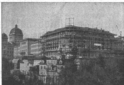
Hotel Bellevue-Palace Bern in Bern. Generalansicht.

Fundationen Brückenbau Wasserbauten Reservoirs, Silos Massivdecken nach eigenen bewährten Systemen Hochbauten aller Art