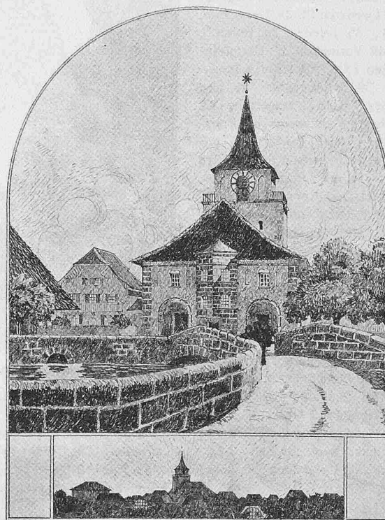
I. Preis, links Variante, rechts Hauptprojekt. — Arch. Hans Klauser, Bern.