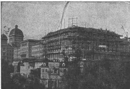
Hotel Bellevue-Palace Bern in Bern. Generalansicht.

Fundationen Brückenbau Wasserbauten Reservoirs, Silos Massivdecken nach eigenen bewährten Systemen Hochbauten aller Art