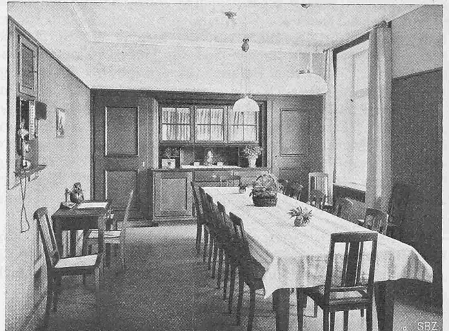
Abb. 13. Speisezimmer der Schwestern im I. Stock.

anmutenden Hauses. Aber trotz ihrer Einfachheit sind die Räume in ihrer diskreten Farbgebung von grosser Wohnlichkeit; dies gilt sowohl von den Krankenzimmern, als besonders auch von den Tagräumen der Patienten und der Schwestern. Nennen wir zum Schluss als Lieferanten der weitläufigen Heizungsanlagen Gebr. Sulzer und der sanitären Installationen „Deco“ in Küsnacht und fügen wir bei, dass ohne die medizinischen Spezialapparate, aber einschliesslich aller andern Installationen, mit Bauleitung und Architekten-Honorar die Baukosten etwa 36 Fr./m 3 nicht überstiegen haben.