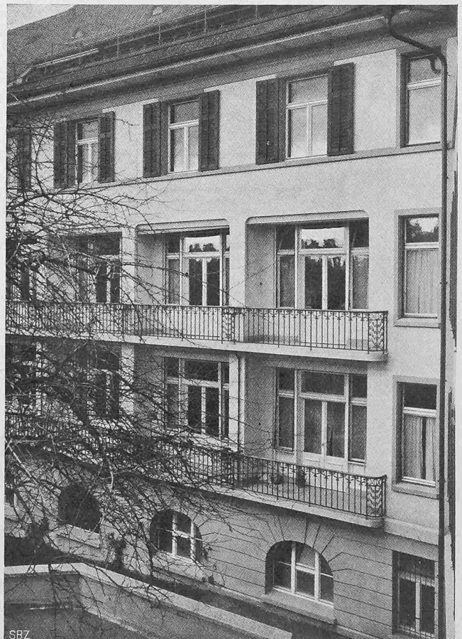
Abb. 10. Balkone der Krankenzimmer an der Südost-Front.

Ueber den neuen Stuttgarter Hauptbahnhof äussert sich Oder in seinem Buche u. a. wie folgt: „... Der neue Bahnhof wird — wie der bestehende — ein Kopfbahnhof. Von Norden her kommt über Feuerbach die Linie von Osterburken (Berlin); sie nimmt unterwegs die Strecken von Bruchsal (Frankfurt) und von Calw auf, dient also dem Zugverkehr dreier Richtungen. Ihre Fortsetzung nach Süden bildet die Bahn über Cannstatt, die sich in die Strecken