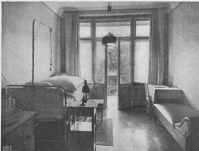
Abb. 12. Krankenzimmer an der Südost-Front.

Erbaut durch Pflegard & Häfeli , Architekten in Zürich.