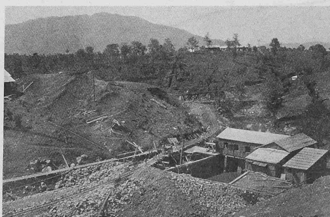
Abb. 9. Reservoir und erstes Pumpenhaus am untern Dammfuss.