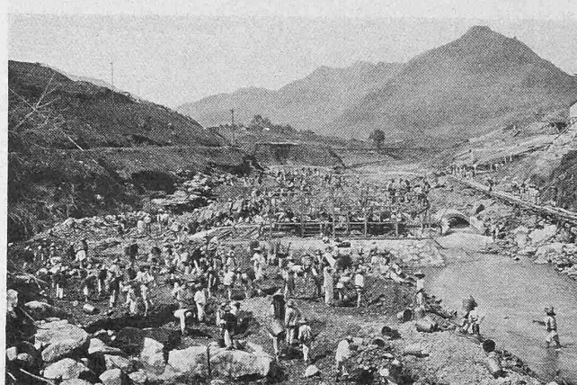
Abb. 10. Baustelle von unten, nach dem Hochwasser im Sept. 1909.