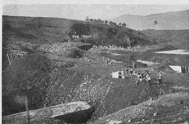
Abb. 8. Materialtransport mit Rollbahn (links) und Körben (rechts).