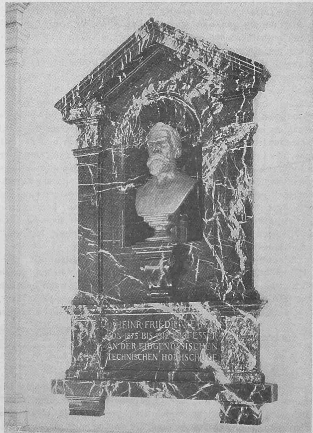
Abb. 2. Umrahmung der Weber-Büste durch Prof. Dr. F. Bluntschli .