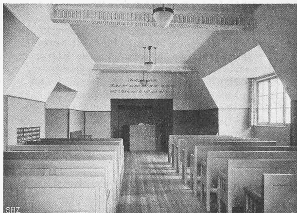
Abb. 3. Asyl «Gottesgnad» in Mett bei Biel; Predigtsaal.

worden. Altersschwach und von den Unwettern übel mitgenommen, wurde sie dann im Herbst 1892 unter grossen Kosten von der Meglisalp nach dem Observatorium auf der Spitze durch ein armiertes, auf die Erde gelegtes einadriges Telegraphenkabel ersetzt und damit wenigstens der obere Teil der Telegraphenlinie, der vorher