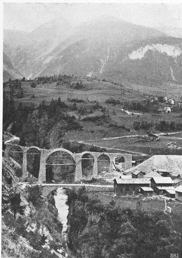
Abb. 11. Grengiols-Viadukt im Bau, Hauptöffnung 22 m.

das C. E. S. seinen Präsidenten, Ingenieur E. Huber , sowie Prof. Dr. W. Wyssling abgeordnet. Von den technischen Fragen, die in Berlin eine in gewisser Beziehung definitive Lösung erfahren haben, seien hier nur die internationalen Vereinbarungen über den spezifischen Widerstand des Kupfers erwähnt, welche Frage den vier grossen staatlichen Prüfungsanstalten in den Vereinigten Staaten, Frankreich, Deutschland und England zur Prüfung überwiesen worden war. Bis dahin hatten die Bestimmungen der verschiedenen Länder über den Widerstand des weichen Kupfers derart variiert, dass diese verschiedenen Abweichungen in der Praxis berücksichtigt werden mussten. Die C. E. I. hat festgestellt, dass der Widerstand eines weichen Normal-Kupferdrahtes von 1 m Länge und 1 mm 2 Querschnitt bei 20° C \frac{1}{88} Ohm beträgt, und dass bei derselben Temperatur der Widerstands-Koeffizient, bezogen auf die Temperatur, 0,00393 für einen Grad Celsius betrage, wobei die Masse des Drahtes konstant bleibt. Die aus der Untersuchung einer grossen Zahl verschiedener Muster gefundene spezifische Dichte des Normalkupfers ist 8,89. Die Leitfähigkeit des industriellen Kupfers soll künftig einfach in Prozenten derjenigen des weichen „Normalkupfers“ der C. E. I. ausgedrückt werden.