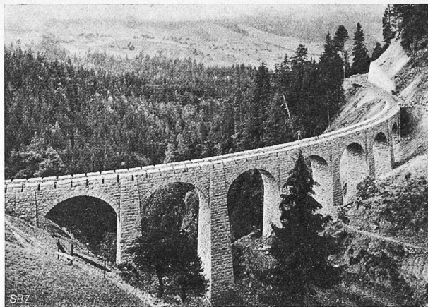
Abb. 10. Laxgraben-Viadukt oberhalb Grengiols.