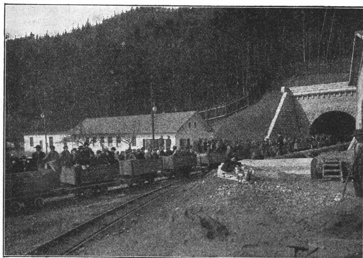
Südportal des Hauenstein-Basis-Tunnels.