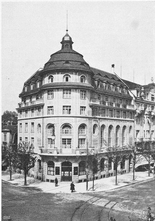
Abb. 9. Gesamtbild aus Südwest; Links: Obergrund — Rechts: Pilatusstrasse.