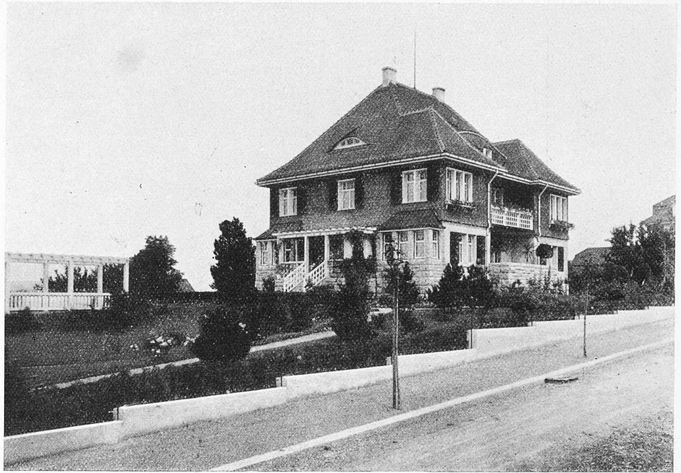
Abb. 4. Villa Altermatt in Frauenfeld von Südwest.

Auch im benachbarten Grossherzogtum Baden hatte das Staatsministerium grösste Sparsamkeit anempfohlen und insbesondere angeordnet, dass alle im Eisenbahnbau-Etat 1914/15 vorgesehenen Bauten, soweit sie noch nicht begonnen sind, bis auf weiteres nicht auszuführen seien. „Es wurde jedoch ausdrücklich angeordnet, von dieser Vorschrift abzuweichen, wo es sich darum handelt, bei eingetretener Arbeitsmangel Arbeitsgelegenheit zu schaffen