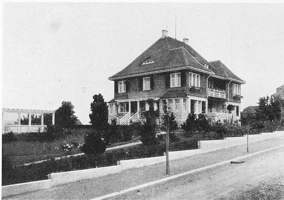
Abb. 4. Villa Altermatt in Frauenfeld von Südwest.

Auch im benachbarten Grossherzogtum Baden hatte das Staatsministerium grösste Sparsamkeit anempfohlen und insbesondere angeordnet, dass alle im Eisenbahnbau-Etat 1914/15 vorgesehenen Bauten, soweit sie noch nicht begonnen sind, bis auf weiteres nicht auszuführen seien. „Es wurde jedoch ausdrücklich angeordnet, von dieser Vorschrift abzuweichen, wo es sich darum handelt, bei eingetretenem Arbeitsmangel Arbeitsgelegenheit zu schaffen