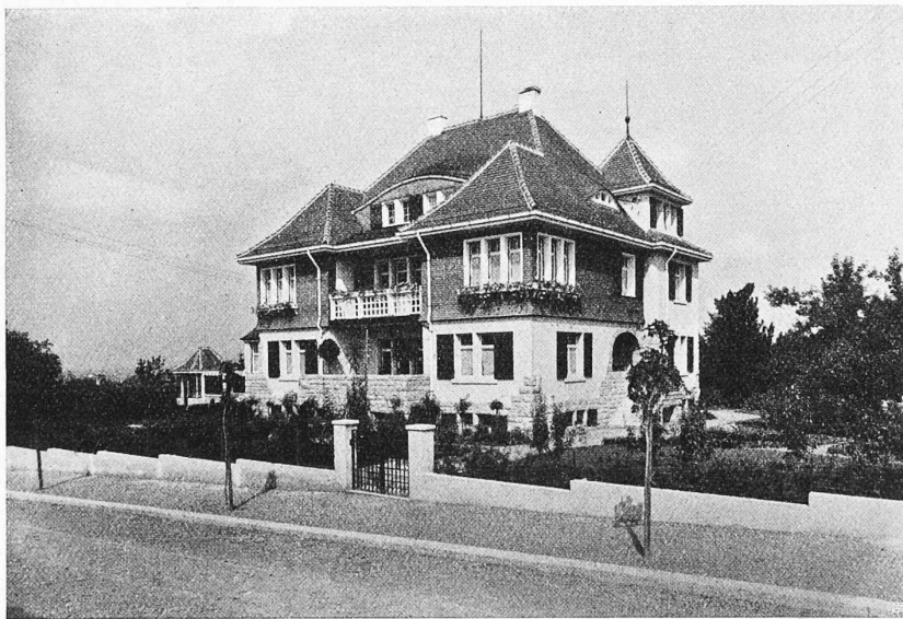
Abb. 5. Villa Altermatt in Frauenfeld von Südost.

An der Speicherstrasse, die von der alten Stadt aus in ziemlich genau östlicher Richtung ansteigt, liegt mit weitem Fernblick gegen Nord und Nordost, über Thurtal und Bodensee, das Haus A. Altermatt. Der Oertlichkeit gut angepasst ist seine Stellung auf dem Bauplatz und die Anlage des architektonisch geformten Gartens. Einteilung und Aussehen des Hauses sind den Bildern zu entnehmen. Der Sockel zeigt rauhes Bossenmauerwerk aus Jurakalk, darüber Terranavaputz auf dem aufgehenden Backstein-Mauerwerk, das im ersten Stock mit groben, eichenen Schindeln verkleidet ist. Kellermauerwerk in Beton, Zwischendecken im Erdgeschoss Eisen und Beton, oben Holz, Doppeldach mit roten Biberschwänzen. Der innere Ausbau ist ziemlich reich: Halle in rotpoliertem Kirschbaumholz mit Stoffbespannung in den Feldern, eingebauter Wandbrunnen, Herrenzimmer in Eiche, Speisezimmer Nussbaum, übrige Zimmer gestrichene Täfer und Tapeten. Auch