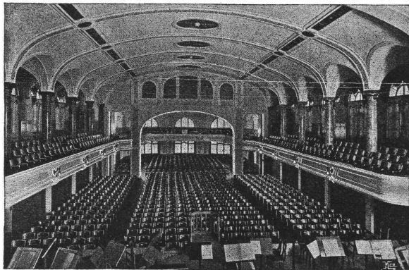
Tonhalle St. Gallen — Möbliert 1909

4-gespalt. Petitzeile oder deren Raum . 30 Cts. Haupttitelseite: 50 Cts. Alleinige Inseraten-An- nahme: Rudolf Mosse, Annoncen-Expedition, Zürich, Basel und deren Filialen und Agenturen