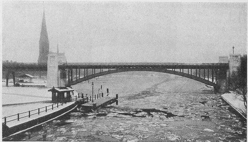
Abb. 20. Kuhlmeileich-Brücke der Hamburger Hochbahn.

Brücke gehen aus Abbildungen 8 und 9 hervor. Die Gelenke sind bei den Punkten G angeordnet, sie sind in gleicher Weise wie bei der Ruhrort-Homburgerbrücke konstruiert, mit dem Unterschied, dass hier genietete Hängelglieder verwendet wurden. Das Emporziehen der Hauptträgergurte in der Mittelloffnung erinnert an die Lachinbrücke in Canada; nur ist die Linienführung der Gurte straffer. Wie Abbildung 10 zeigt, ist das Aussehen ganz gefällig und es gewinnt noch mehr bei der Betrachtung des Bauwerkes an Ort und Stelle. Die Brückenform ist