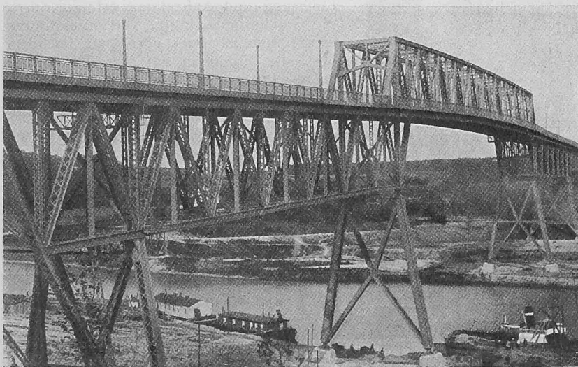
Abb. 10. Strassenbrücke über den Kaiser Wilhelm-Kanal bei Holtenau.