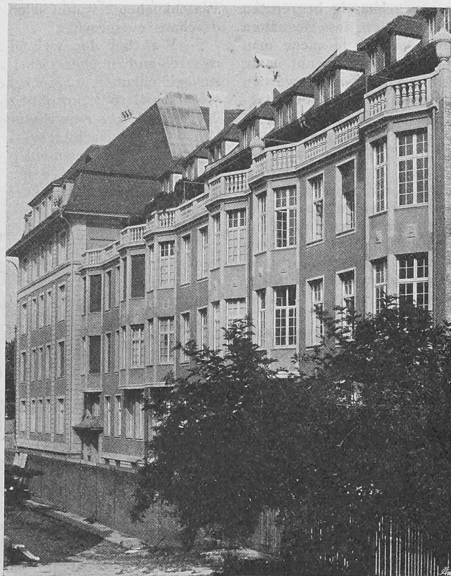
Abb. 7. Nordwest-Fassade der Häuser am Pelikanweg.

Wie dem Grundriss (Abbildung 1, Seite 115) zu entnehmen, liegt das ziemlich unregelmässig geformte Grundstück an drei Strassen, von denen Tiergartenrain und Birsigstrasse aus dem vom hochliegenden Viadukt überbrückten Birsigtal nach dem horizontal verlaufenden Pelikanweg ansteigen. Lage und Form des