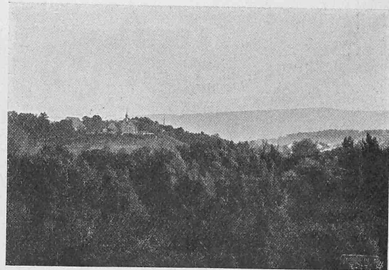
Abb. 3. Aussicht gegen Süden (St. Margarethen).