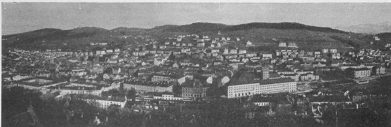
Abb. 1. Ansicht von St. Gallen mit dem Wettbewerbsgebiet vom gegenüberliegenden Hang des Rosenberges.

„Rudolf Gelpke“ und „Fendel 22“ die Rückreise nach Basel anzutreten und unterwegs die Augster Schleuse und die Kraftwerke Augst-Wyhlen, sowie in Basel die Hafenanlagen zu besichtigen. Ein einfaches Abendessen soll die gemeinsame Tagung beschliessen.