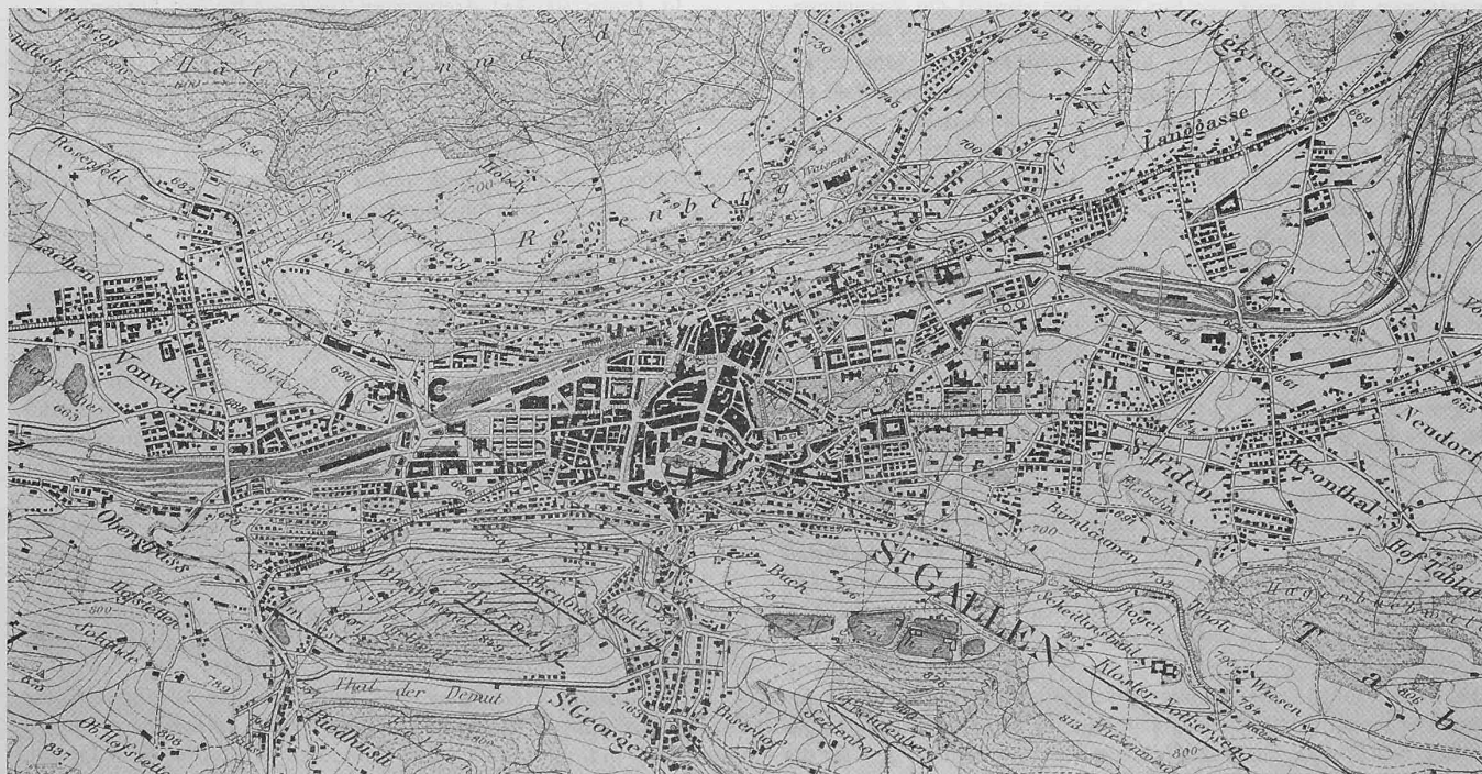
Abb. 2. Uebersichtsplan der Stadt St. Gallen und Umgebung. — 1:25 000. — Mit Bewilligung der Schweiz. Landestopographie vom 18. VII. 1913.

Durch den Wettbewerb sollen für die gegenüber dem Rosenberg ziemlich steil nach der Stadt zu, gegen Nordwest abfallenden, grossenteils noch unbebauten Hänge (Abb. 1 und 2) geeignete Ueberbauungs-Vorschläge gewonnen werden. Die Aufgabe ist eine dreifache; sie besteht erstens im Studium eines zweckmässigen Strassen-netzes, zweitens im Studium der Ueberbauung und drittens im Studium eines Baureglements, das die möglichste Einhaltung der als wünschenswert erachteten Bauweise gewährleistet. St. Gallen besitzt eine Zonenbauordnung mit vorläufig vier Zonen; das dem Wettbewerb unterstellte Gebiet soll als fünfte Zone dem Wohnbedürfnis des Mittelstandes in Einzel-, Gruppen- und Reihenhäusern nutzbar gemacht werden. Es soll, und darauf legt die ausschreibende Behörde grossen Wert, studiert werden, wie nach Höhe, Gruppierung, Gebäudestellung zu den Strassen die Uebelstände vermieden werden