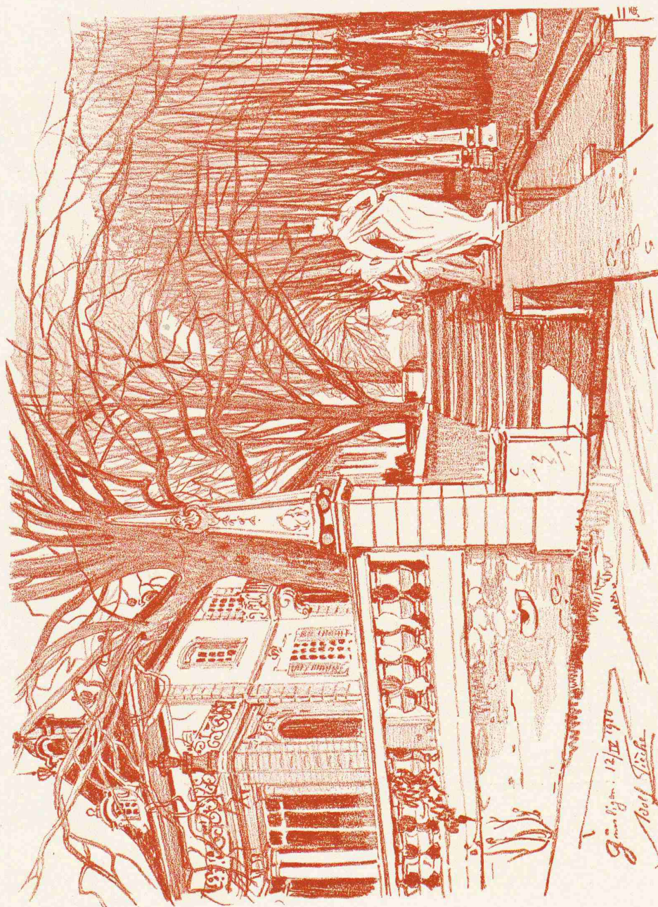
AUS BERNISCHEN LANDSITZEN DES XVIII. JAHRHUNDERTS

Nach einer Rötzelzeichnung von AD. TIËCHE, Architekturmaler in Bern