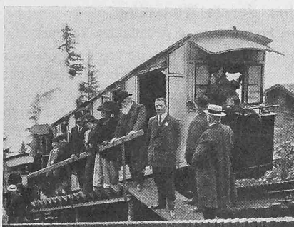
Der Präsident ↑

Des andern Morgens um 8 \frac{1}{4} Uhr war die geschäftliche Sitzung des Ausschusses, über die das Protokoll berichten wird. Nach getaner Arbeit traf sich die ganze Gesellschaft auf dem Schiff, zur Fahrt nach Alpnachstad, denn es galt dem Pilatus einen Besuch abzustatten. Dazu hatte uns in zuvorkommender Weise Direktor W. Winkler zwei Extrawagen der berühmten Pilatusbahn spendiert, sodass in jeder Hinsicht sorgenlos (von einigem Klopfen eines zarten Frauenherzen abgesehen) die steile Höhe erklettert wurde. Denn es ist ein eigentliches Klettern, das diese Dampfmotorwagen an der Zahnstange von 48% Steigung vollführen, langsam aber stetig und sicher, wie geübte Bergführer es tun. Es ist ein ganz eigenartiger Genuss so mühelos aus der Tiefe zur Höhe gleiten zu können, zu beobachten, wie die Bilder sich ständig verschieben, der blaigrüne See und die Talgründe immer mehr in dämmrige blaue Tiefe versinken und der helle Gipfel immer näher grüsst. Oben angelangt genossen wir zwar keine sehr weite Fernsicht, dafür aber einen Blick in die in wunderbar zarte Farben getauchte Tiefe, auf Luzern