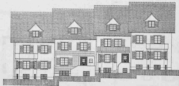
Abb. 3. Südfassade 1:400. — Abb. 4 (oben) Schnitt 1:200.

Arch. Otto Pflughard . Arch. O. Pfister . Ing. Carl Jegher . Ortsvorsteher Dr. K. Halter . Gemeindefreiber H. Brenner .